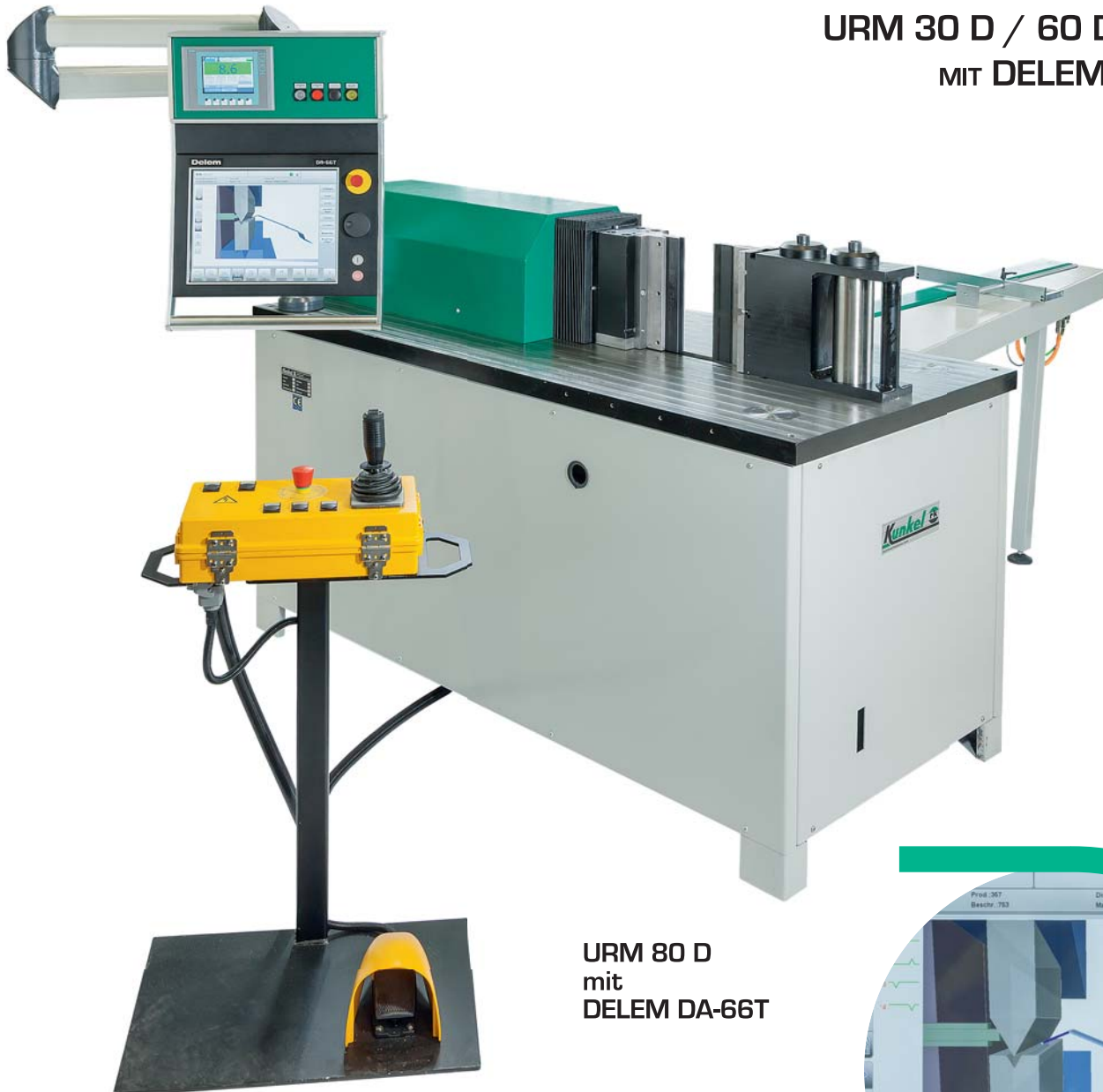
URM 80 D mit DELEM DA-66T