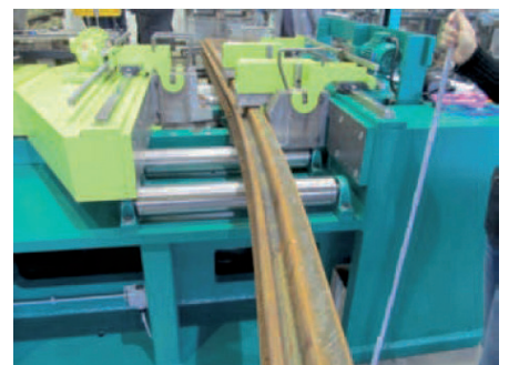
Bending of grooved rails