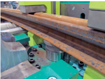
Hydraulic cylinder vertical with hold-down