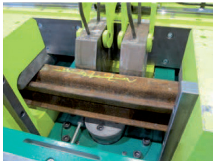
Hydraulic cylinders with straightening